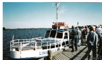
Många ville följa med Huskvarnaavdelningen till Finlandsresa i juli