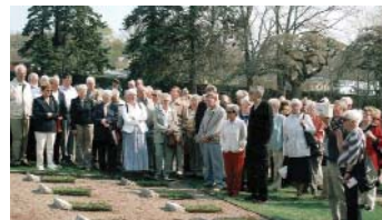
I Varberg samlades 165 medlemmar från Föreningen Norden i Bohuslän och Halland en försommardag. Kusthotellet och den gamla tuberkuloskyrkogården var första anhalten

Antalet biblioteksmedlemmar, som är såväl folkbibliotek som skol- och institutionsbibliotek, har minskat under de senaste åren och 2006 var de ..... (att jämföra med 313 år 2005).