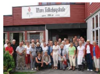
Föreningen Norden Laholm reste på vänortsträff till norska vänorten Ørsta och Volda i Romsdals fylke

Europaveckan i Ulricehamn firades 8-14 maj med nordiskt besök och en resa till vänortskonferensen i Övre Eiker. Kommunens internationella kontakter presenterades vid en utställning på Stadsbiblioteket. Och naturligtvis vajade de nordiska flaggorna och EU-fanan på de 16 flaggstängerna vid Järnvägsområdet.