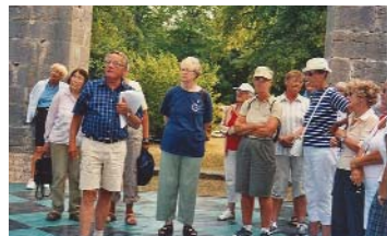
Nordenmedlemmar från västkusten och Jönköping besökte Gotland