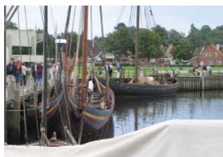
Nordenföreningar från båda sidor om Öresund hade sin träff förlagd till Roskilde. På programmet stod bland annat besök på Vikingeskibsmuseet

Norden i Bio baseras på det danska pilotprojektet "Med Norden i Biografen" som mycket framgångsrikt genomfördes hösten 2004 i grundskolor i södra Jylland i Danmark. Föreningarna Nordens Förbund (FNF) och de nordiska informationskontoren låg bakom projektet Norden i Bio, som huvudsakligen finansierades av Nordiska kulturfonden. Målet var att 1000 skolklasser, från 8:e klass och uppåt, i hela Norden skulle delta i projektet, d.v.s. att 20-30 000 14-19-åriga elever skulle få chansen att öka sina kunskaper i de nordiska språken.