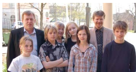
18 barn från de nordiska vänorterna firade Europaveckan i Ulricehamn 8-14 maj