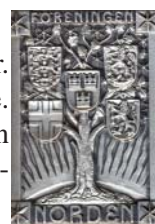
Föreningen Nordens silverfärgade förtjänstplakett

Styrelsen består av nio ledamöter förutom ordföranden och mandatperioden är två år. Åtta ledamöter utses av fullmäktige som också väljer en av dem till vice ordförande. Minst en av dessa ledamöter utses från de samverkande medlemmarna och en från ungdomsförbundet. Den nionde ledamoten utses av personalen vid föreningens kansli.