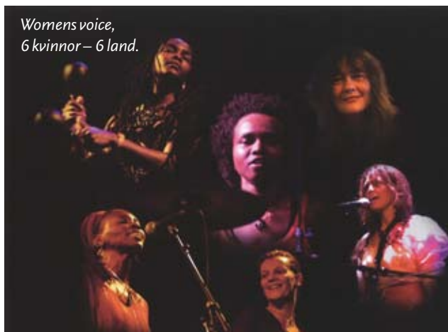
Womens voice, 6 kvinnor – 6 land.