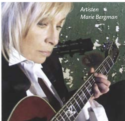
Artisten Marie Bergman