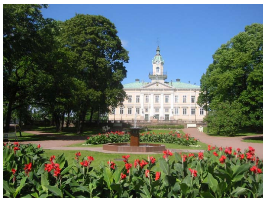
Pampigt i Björneborg