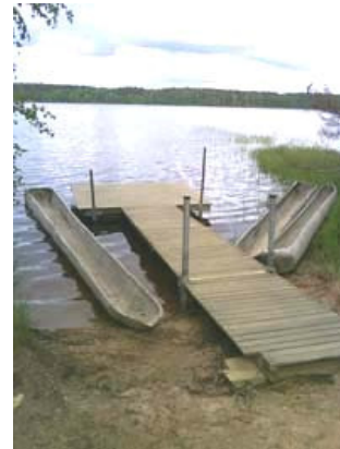
Stenåldersbåtar som kan lånas för en roddtur på sjön.