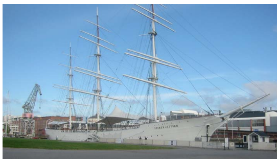
3-mastare i Åbo