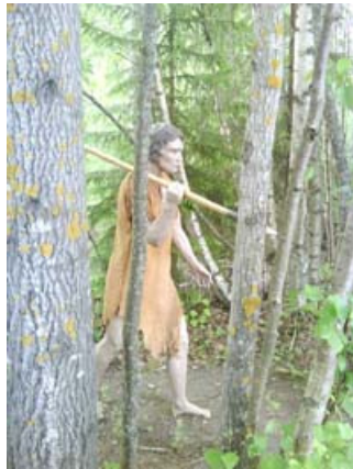
Här skriker en stenåldersman till jakt.