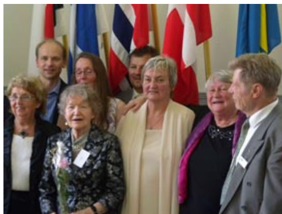
Stadsdirektören, kommunalråd, ordföranden och hedersmedlem samlade framför ländernas flaggor.

4-kant mötet gav oss ett tillfälle att lära känna värdfolket i Saarijärvi och även att umgås med kollegorna från Danmark och Norge. Vi fick en bra inblick i en finsk småstad och dess historia och framtidsplaner.