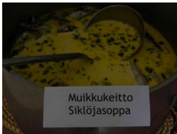
Fisksoppa med småfiskar som äts hel med huvud och ben fick vi på festen!