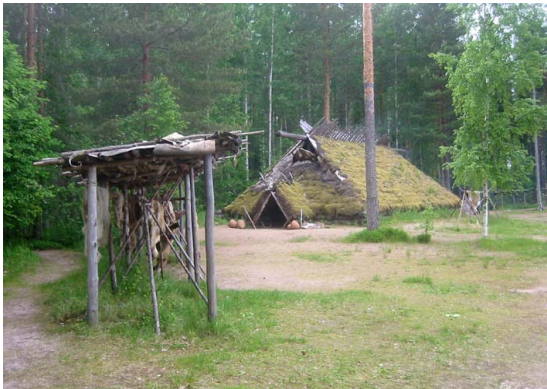
Så här kan husen ha varit, med skinn som hänger till tork utanför.