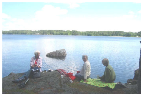
Fika i typiskt idylliskt finskt landskap