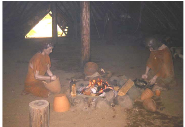
Maten lagades vid öppen eld.