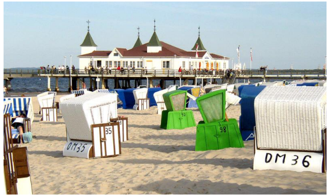
Badstrand på ön Usedom