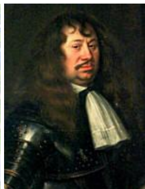
Carl Gustav Wrangel