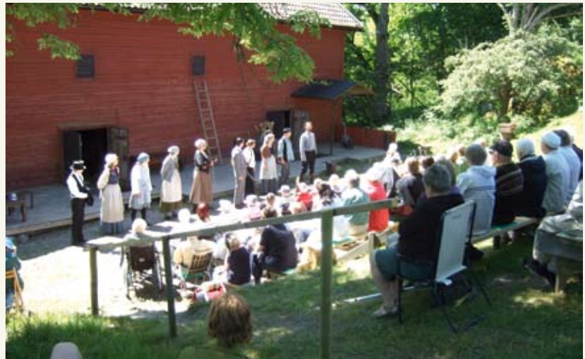
Sommarteater på Biskops-Arnö